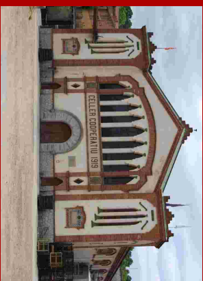
El Celler Cooperatiu modernista de l'arquitecte Cèsar Martinell.

Dep. d'Agricultura, Alimentació i Acció Rural Av. Priorat, s/n.